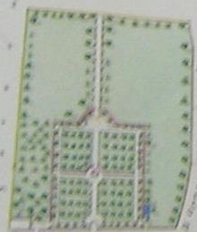
Sito del Krendi

Consiste in 2 parti seguite A e B la prima in cui che l'ingresso principale, è diviso da un recinto ed è suddiviso in 2 porzioni destinate alla coltura degli aranci, i nuclei di queste porzioni sono anche sui esiti di aranci, ed alla distanza di palmi 50 corre parallelamente ad essi un viale il cui lato interno è interrotto dalla porta, che mette nella seconda parte B, e qui finisce in un arco di circolo, in una di queste porzioni si sono 55 aranci, e in siti e nell'altra si hanno, 11 limoni, 9 siti, 5 peri e 2 pini. La seconda parte seguita B è dal prolungamento del viale divisa in 2 porzioni, la porzione occidentale è nella maggior parte destinata alla coltura di fichi d'India, con stauri, cisterne, 9 melograni, 1 pino, 3 fichi, 10 siti, e 2 limoni. L'altra porzione poi è nella maggior parte destinata alla coltivazione con cisterne, alcuni fichi d'India, 1 melograno, 2 limoni, 3 fichi, 10 siti, 5 perai, 1 nocciuolo, ed 1 sugino, avendosi queste porzioni hanno una piccola parte per lo stendo, e comunicano colla parte seguita A, per mezzo di due porte praticate nei muri longitudinali del recinto su-mentionato. Il giardino è soggetto solo all'interspetto dei tetti Uppu ed Ellat, tale servitù si potrebbe del tutto levare, obbligando i mencionati proprietari ad innalzare l'opera morta dei tetti della capacità di 2000000 4 4 2